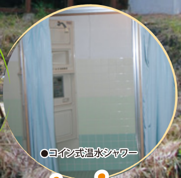
●コイン式温水シャワー