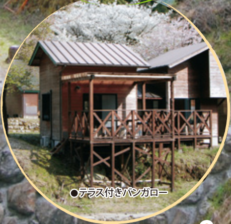
●テラス付きバンガロー