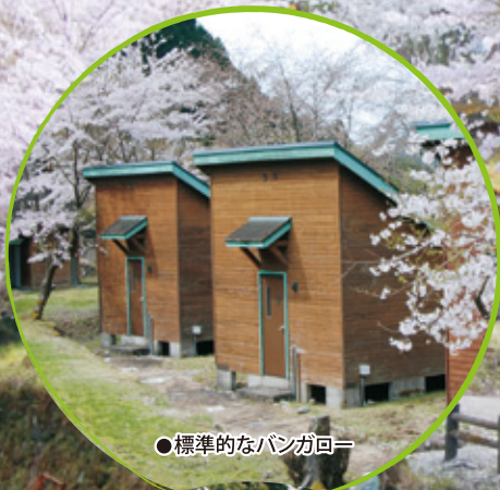
●標準的なバンガロー

南紀の秘境百間山溪谷の入口にあるキャンプ村。 近くにはハイキングコースが隣接。 バンガローも設置されているので、ファミリーで キャンプホリデーが楽しめます!!